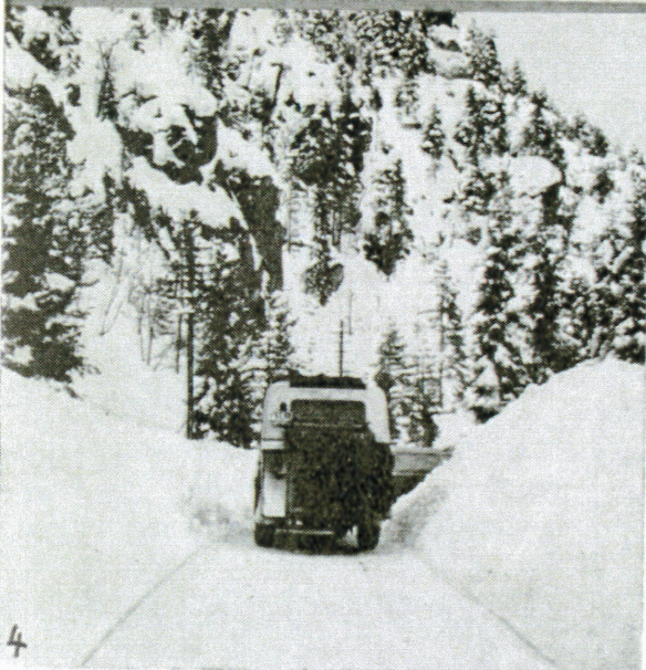
Fig. 3. Sørlandske hovedvei i Søgne 17. februar 1937. Fig. 4. Brøitet vei mellom Kristiansand og Arendal 18. februar 1937.