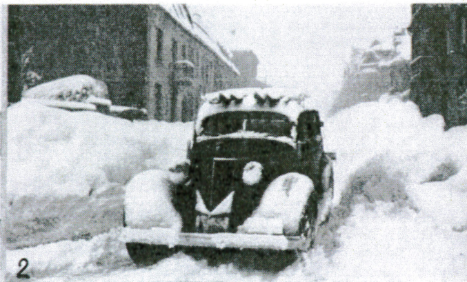
Fig. 2. Ankomst til Kristiansand 17. februar 1937.