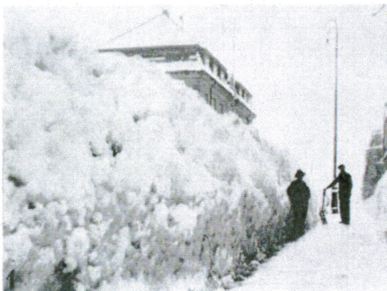
Fig. 1. Fra Kristiansand 17. februar 1937.

En særlig vanskelighet under brøitingen på Sørlandet er de forholdsvis smale veier, som hindrer brøitebilene i å benytte den fart som er ønskelig for å få kastet sneen ut. Under så ekstraordinære